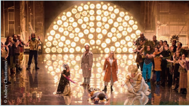
Phaéton de Lully, première à l'Opéra Royal le 30 mai 2018, production soutenue par l'ADOR.